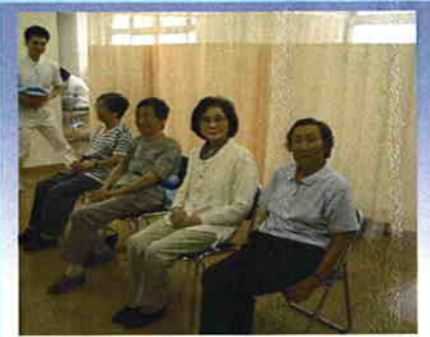
ホットパック & 筋トレ中