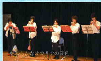
三輪小学校の歌声