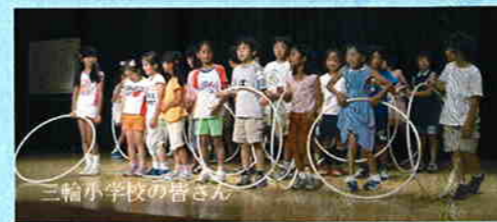
三輪小学校の歌声