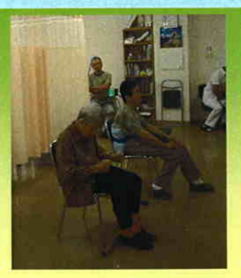
ホットパック & 極超短波 (マイクロ)