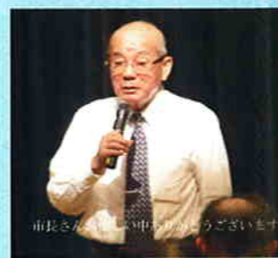
市長さん、ご挨拶です