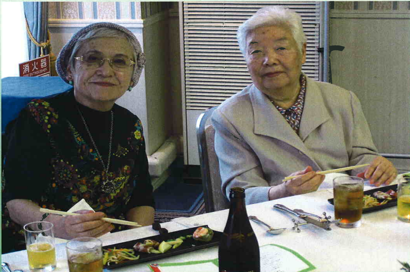
デイサービス4周年記念行事「ホテルでランチとカラオケ」