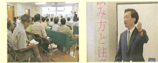
前回講演会 三宅良彦医師(9 月 9 日)

三輪診療所外来担当 毎週(月)(金)(土)いずれも午前 ご来場をお待ち申し上げております