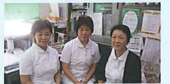
辻看護部長(中央)と部長室スタッフ