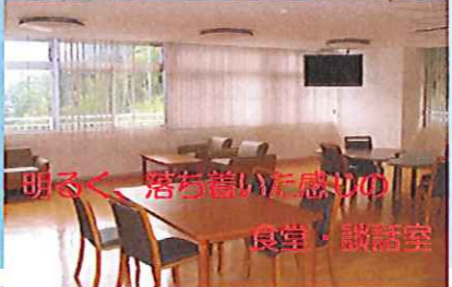
明るく、落ち着いた感じの