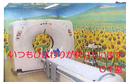
いつもひまわりが咲いています