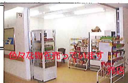
色々な物を売っています