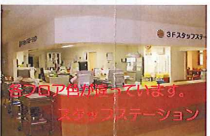
各フロア色が揃っています。